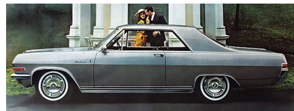
DIPLOMAT V8 COUPE